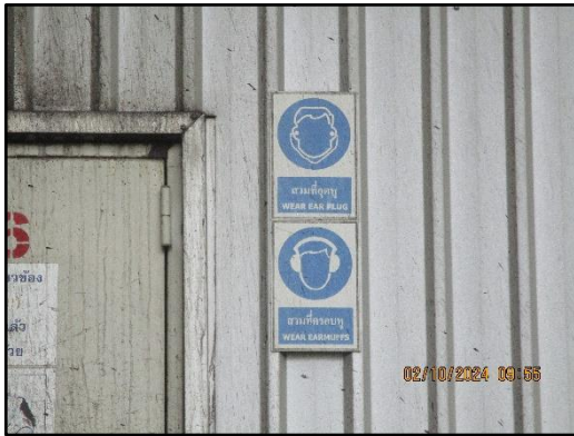
ภาพที่ 2.15 ป้ายเตือนบริเวณที่มี เสียงดังเกิน 85 dB(A)