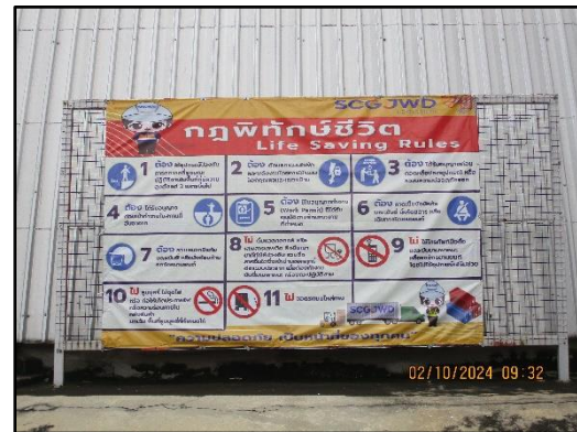
ภาพที่ 2.40 ป้ายประชาสัมพันธ์เกี่ยวกับความปลอดภัยด้านต่าง ๆ ภายในโครงการ