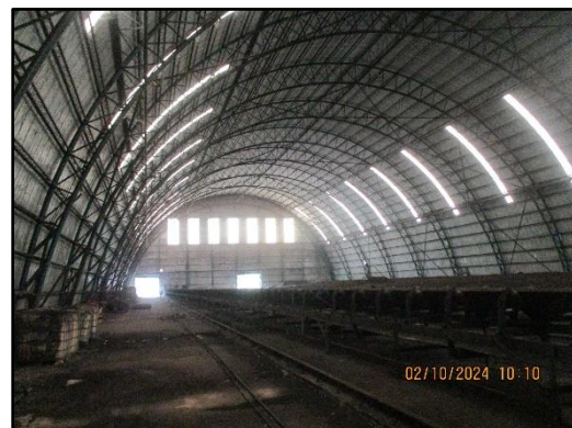
ภาพที่ 2.47 สภาพกองถ่านหินของโครงการ