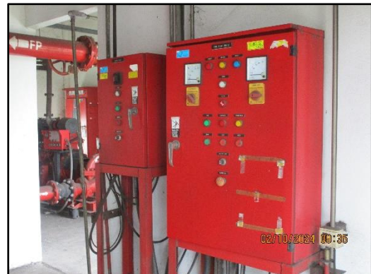
ภาพที่ 2.44 เครื่องสูบน้ำและอุปกรณ์ดับเพลิงภายในโครงการ