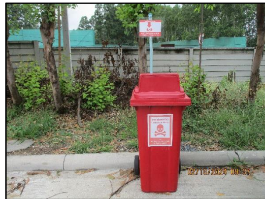
ภาพที่ 2.19 ถังขยะแยกประเภทภายในโครงการ