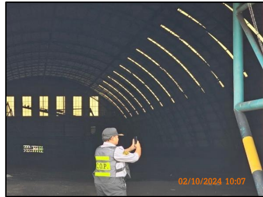
ภาพที่ 2.45 เจ้าหน้าที่รักษาความปลอดภัยบริเวณโกดังเก็บถ่านหิน