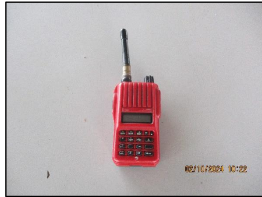
ภาพที่ 2.16 วิทยุสื่อสารที่ใช้ติดต่อสื่อสารใน โครงการและระหว่างเรือลำเลียงสินค้า