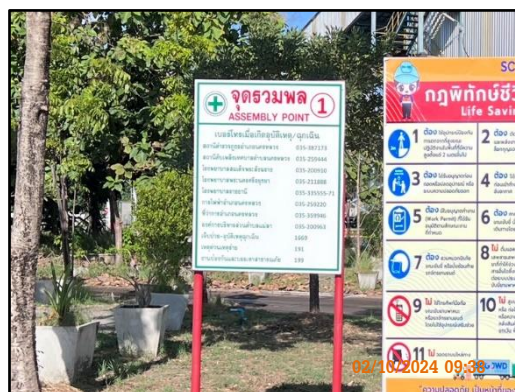
ภาพที่ 2.42 จุดรวมพลภายในโครงการ