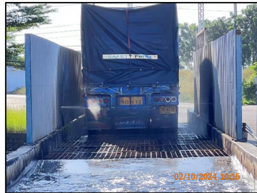
ภาพที่ 2.9 บอล้างล้อรถบรรทุกก่อนออกจากพื้นที่โครงการ