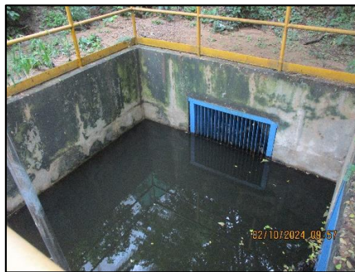
ภาพที่ 2.38 บ่อหนองน้ำฝน