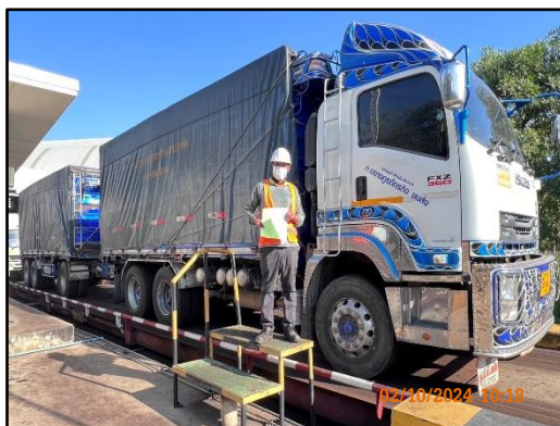
ภาพที่ 2.11 พนักงานขับรถบรรทุกสวมใส่อุปกรณ์ป้องกันขณะนำรถเข้ารับ-ส่งสินค้าของโครงการ