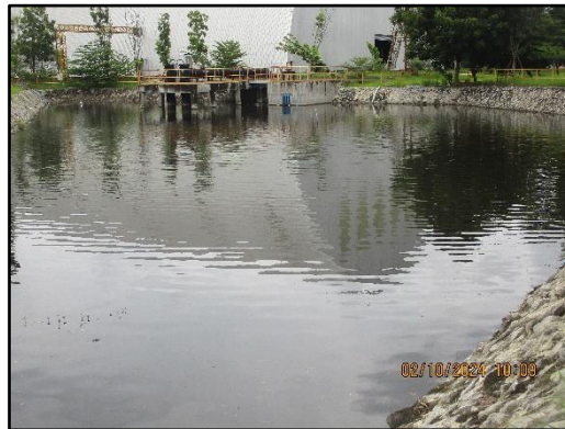
ภาพที่ 2.17 ป่อพักน้ำทิ้งของโครงการ