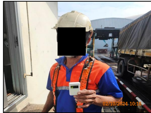
ภาพที่ 2.24 การตรวจวัดปริมาณแอลกอฮอล์ของพนักงานขับรถบรรทุกก่อนรับถ่านหินออกจากโครงการ