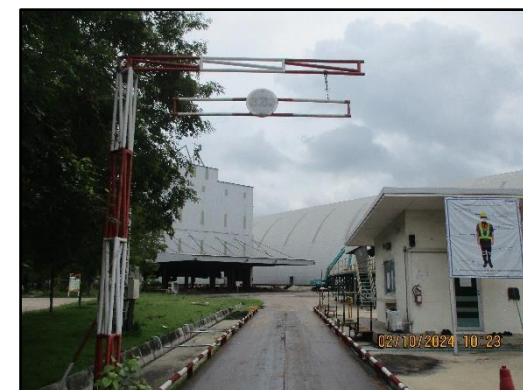
ภาพที่ 2.23 ด้านขังน้ำหนักรถบรรทุกขนส่งถ่านหิน