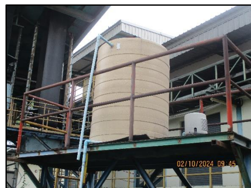
ภาพที่ 2.30 ถังน้ำสำรองน้ำประปา