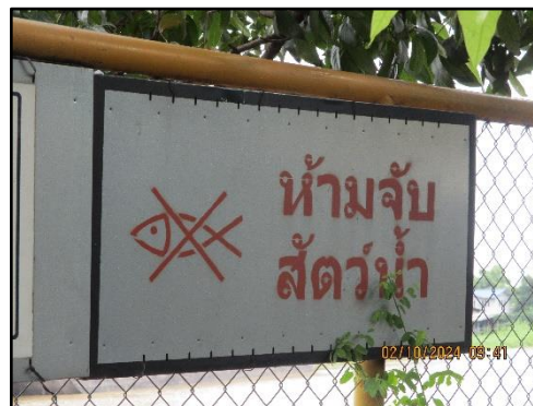
ภาพที่ 2.22 ป้ายห้ามจับสัตว์น้ำบริเวณหน้าท่าเทียบเรือของโครงการ