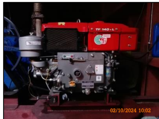
ภาพที่ 2.50 เครื่องปั่นไฟพร้อมสายไฟและปลั๊กไฟภายในเรือลำเลียงสินค้า