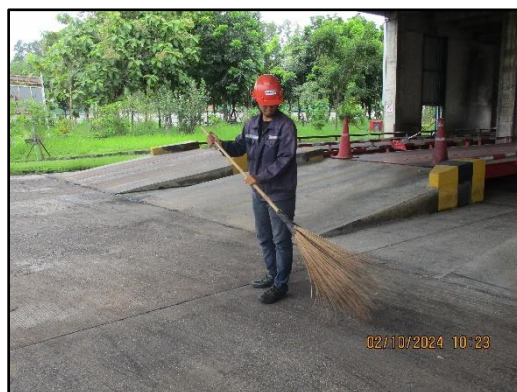
ภาพที่ 2.7 พนักงานเก็บกวาดถ่านหิน