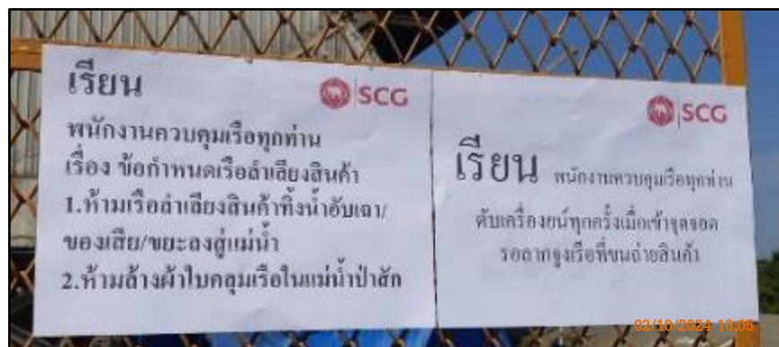
ภาพที่ 2.33 ป้ายห้ามเรือลำเลียงสินค้าทั้งน้ำอับเฉา/ของเสีย/ขยะ ลงสู่แม่น้ำสาธารณะ