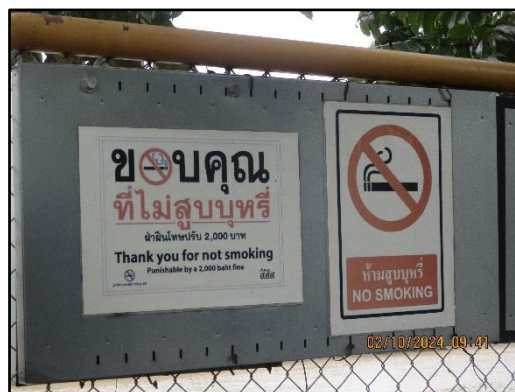
ภาพที่ 2.41 ป้ายห้ามสูบบุหรี่ในเขตพื้นที่โครงการ