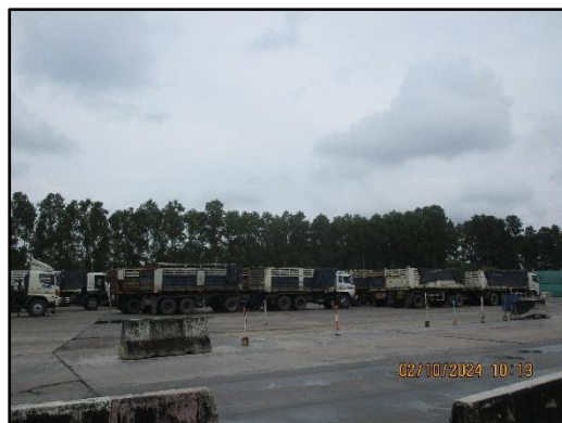
ภาพที่ 2.1 ลานจอดรถบรรทุกของโครงการ