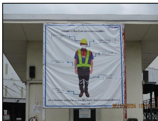
ภาพที่ 2.14 ป้ายเตือนอันตรายต่าง ๆ ภายในพื้นที่โครงการ