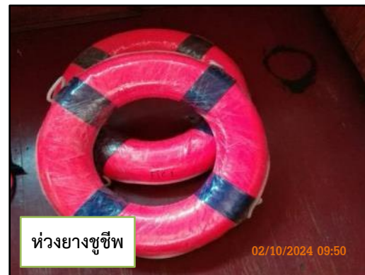
ภาพที่ 2.43 อุปกรณ์ความปลอดภัยบนเรือลำเลียงสินค้า สำหรับกรณีฉุกเฉิน