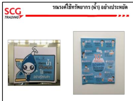
ภาพที่ 2.31 ป้ายรณรงค์ปลูกจิตสำนึกให้พนักงานใช้น้ำอย่างประหยัด