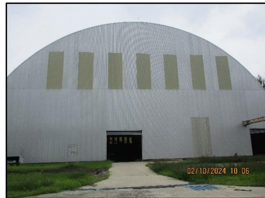
ภาพที่ 2.39 สภาพอาคารและสภาพพื้นที่โครงการ