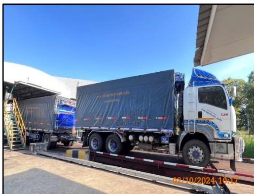
ภาพที่ 2.8 รถบรรทุกสินค้าที่มีการคลุมผ้าใบระหว่างการขนส่ง