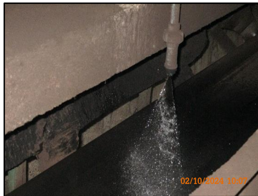
ภาพที่ 2.48 การฉีดพรมน้ำหรือสเปรย์น้ำบริเวณสายลำเลียงและกองเก็บถ่านหิน