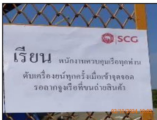
ภาพที่ 2.2 ป้ายดับเครื่องยนต์ทุกครั้งที่เข้าจอดบริเวณลานจอดรถ และบริเวณที่จอดเรือ สำหรับรอลากจูงเรือขนถ่ายสินค้าของโครงการ