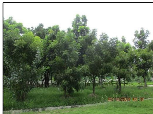
ภาพที่ 2.21 การดูแลรักษาต้นไม้ในพื้นที่สีเขียวของโครงการ