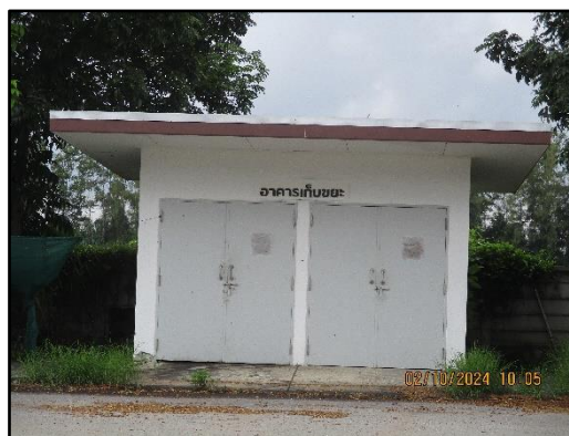
ภาพที่ 2.32 ห้องพักขยะมูลฝอยและของเสียอันตราย