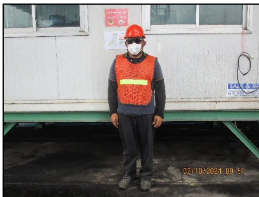
ภาพที่ 2.6 พนักงานสวมใส่อุปกรณ์ป้องกันอันตรายขณะปฏิบัติงาน