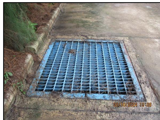
ภาพที่ 2.36 รางระบายน้ำรอบโครงการ