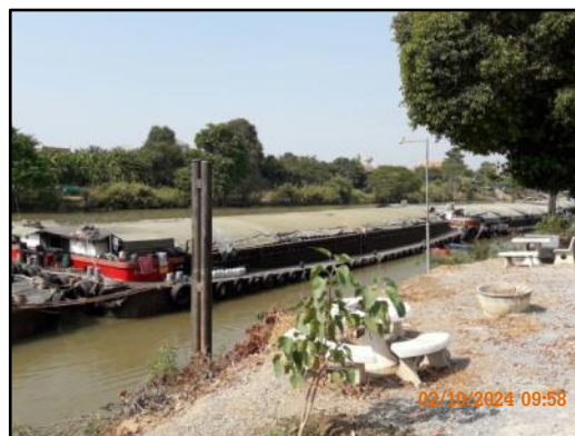
ภาพที่ 2.3 บริเวณที่จอดเรือสำหรับรอลากจูงเรือขนถ่ายสินค้า