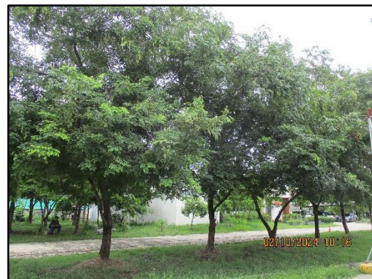
ภาพที่ 2.10 การปลูกต้นไม้ยืนต้นบริเวณริมรั้วพื้นที่โครงการ