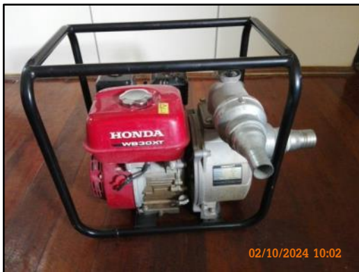
ภาพที่ 2.51 เครื่องปั่นน้ำพร้อมสายยางสำหรับดูดน้ำและสายยางสำหรับฉีดน้ำดับเพลิงภายในเรือลำเลียงสินค้า