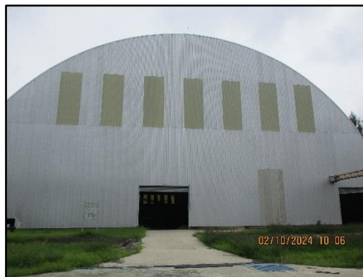
ภาพที่ 2.46 สภาพโกดังจัดเก็บถ่านหินของโครงการ