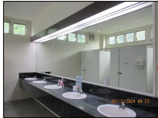
ภาพที่ 2.34 ห้องน้ำ-ห้องสุขาภายในโครงการ