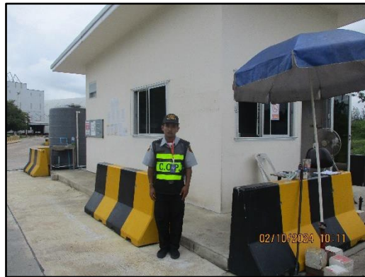
ภาพที่ 2.28 พนักงานคอยดูแลเรื่องการจราจรของรถบรรทุกสินค้าที่เข้า-ออกโครงการ