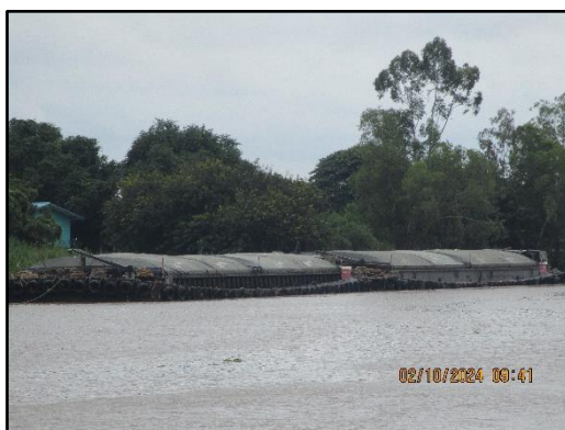
ภาพที่ 2.12 เรือขนถ่ายสินค้าที่มีการปิดคลุมผ้าใบ