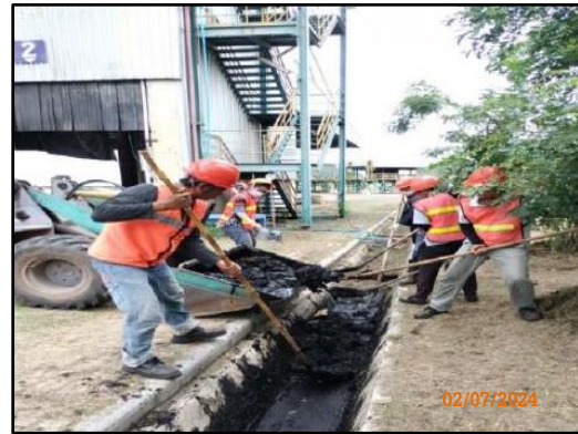
ภาพที่ 2.37 การขุดลอกกระบายน้ำภายในพื้นที่โครงการ