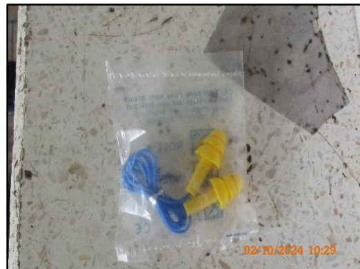
ภาพที่ 2.5 อุปกรณ์ป้องกันอันตรายส่วนบุคคลสำรอง