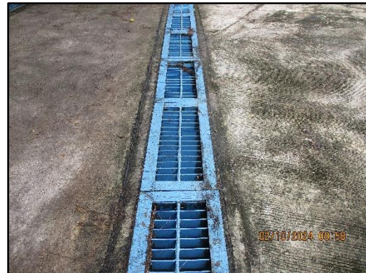
ภาพที่ 2.18 รางระบายน้ำภายในพื้นที่โครงการ