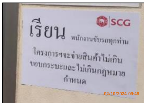
ภาพที่ 2.29 ป้ายจำกัดความสูงรถบรรทุก และป้ายห้ามถ่านหินล้นขอบกระเบาะของรถบรรทุกสินค้า