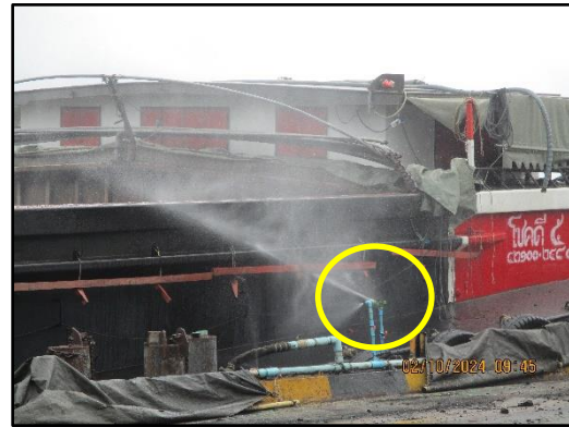
ภาพที่ 2.4 การติดตั้งสเปรย์น้ำบริเวณที่มีการลำเลียงถ่านหินขึ้นจากเรือ