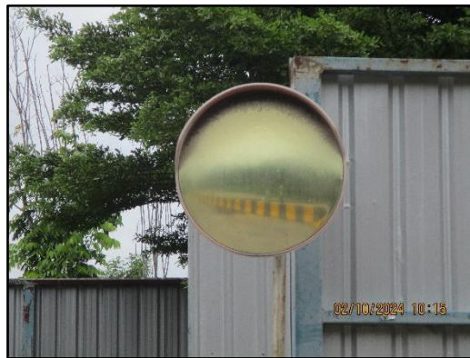
ภาพที่ 2.13 ป้ายกำหนดความเร็วของรถบรรทุกสินค้า และป้ายจราจรในพื้นที่โครงการ (ต่อ)