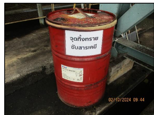
ภาพที่ 2.20 ถังทรายศูดูดซับน้ำมันบริเวณท่าเทียบเรือของโครงการ