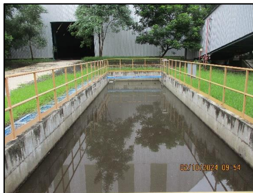
ภาพที่ 2.35 บ่อดักครบน้ำมันและไขมัน (Oil Separator)