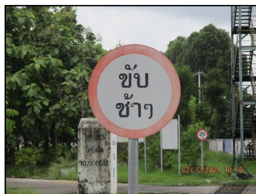
ภาพที่ 2.13 ป้ายกำหนดความเร็วของรถบรรทุกสินค้า และป้ายจราจรในพื้นที่โครงการ