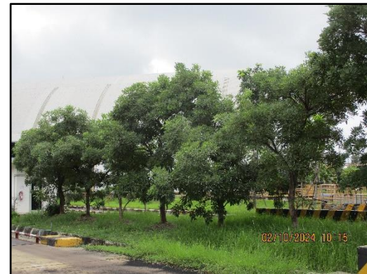
ภาพที่ 2.21 (ต่อ) การดูแลรักษาต้นไม้ในพื้นที่สีเขียวของโครงการ