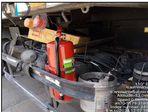
ภาพที่ 2.49 ถังดับเพลิงบนรถบรรทุกสินค้า