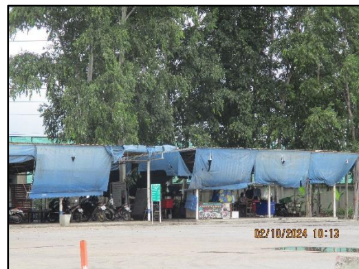
ภาพที่ 2.25 ที่พักพนักงานขับรถบรรทุก